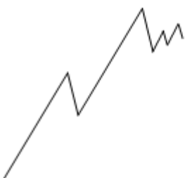
Phase 5.2 (keine tiefe Korrektur)